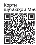
Корти шӯъбаҳои МБС