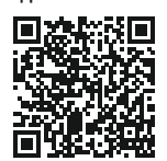
Тасдиқ дар сомонаи хизматрасонии давлатӣ